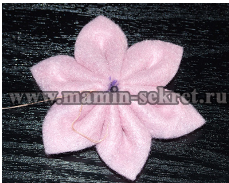
Цветок из фетра в технике канзаши готов.