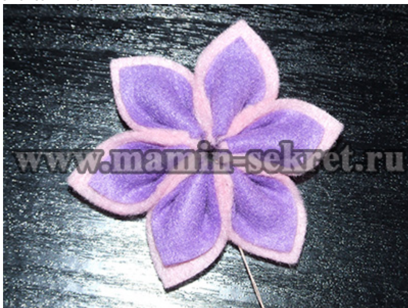
В центр цветка можно пришить красивую пуговицу или бусину.